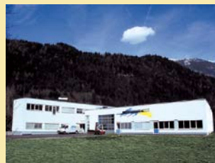
Our company site in Schwarz/Tyrol. Unser Standort in Schwaz/Tirol.

Fiecht-Au Nr. 32 A-6130 Schwaz T. +43/5242/71235-0 F. +43/5242/71235-5 office@spezialmaschinen.at www.spezialmaschinen.at www.schwaigertools.at www.iq-tools.at